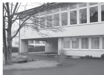
Kirchgemeindehaus Oberarth Türlweg 8 6414 Oberarth

Wir vermieten die Räumlichkeiten im Kirchgemeindehaus für verschiedene Veranstaltungen. Bitte wenden Sie sich mit Ihrer Anfrage an unser Kirchgemeindebüro, Tel. 041 / 855 08 10