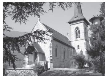
Evang.-ref. Kirche Oberarth Gotthardstrasse 26 6414 Oberarth

Wenden Sie sich für eine Reservationsanfrage bitte an unser Kirchgemeindebüro, Tel. 041 / 855 08 10