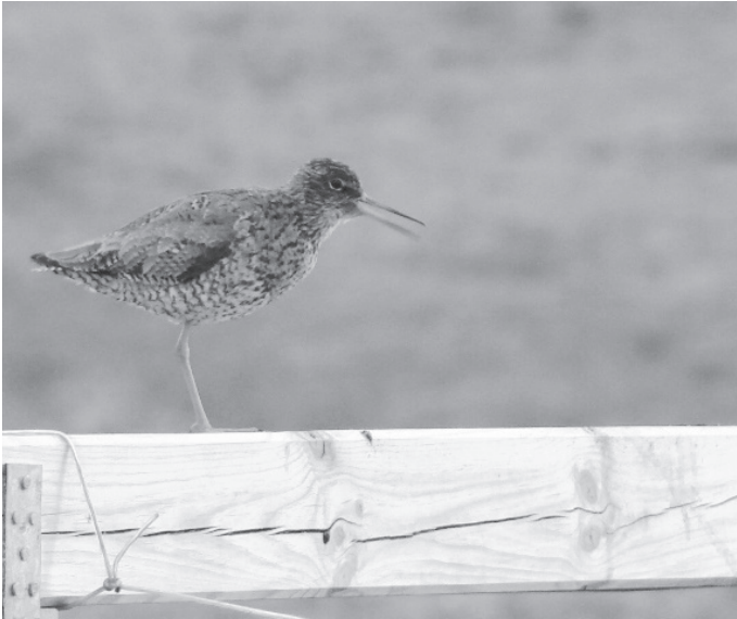
Rotschenkel in Borgarnes Island

Frühling ist ein natürliches und spirituelles Phänomen. Es steht für unser Hoffen auf neues und kraftvolles Leben. Ostern ist mehr als Hase und Eier.