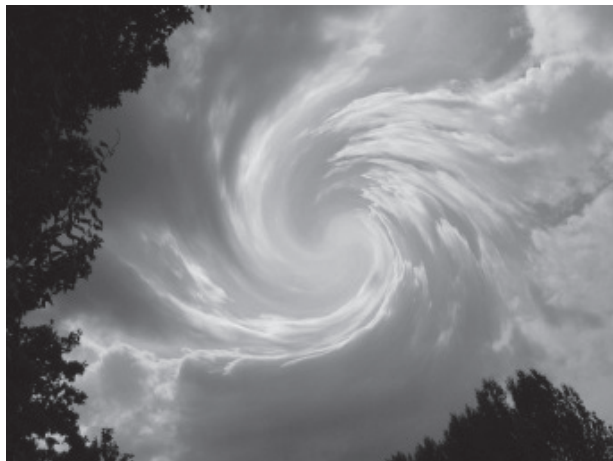
Aus dem Zentrum leben und Energie gewinnen

en: «Wenn du Gott sagst, dass dich ein Fehler oder etwas Schweres belastet, dann ist er auch bei dir. Da steht nichts mehr zwischen dir und Gott. Kein Mensch, keine Idee, keine Angst.» Ich habe diesen Herbst mehrfach erlebt, wie sich nach solchen einfachen Sätzen etwas öffnet. Man sieht es an den Augen!