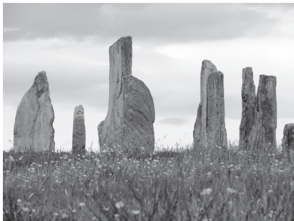
Standing Stones, Callanish – 5000 Jahre alt

einen Abendmahlstisch, wo Brot und Wein, wo Stärkung für Leben und Glauben ausgeteilt werden. Allerdings unter der Gottesgegenwart des Heiligen Geistes, was uns von betrachtenden Konsumenten zu befähigten Teilhabern am Gottesreich macht. Vergangenheit wird weder glorifiziert noch idealisiert, sondern entfaltet umgekehrt ihr Potential erst im Jetzt. So alt und tiefgründig verankert der Glaube ist, so will er doch nur heute leben. Heute wird gehofft, geglaubt und geliebt. Und da interessiert uns die ganze Welt – die vergangene und die heutige.