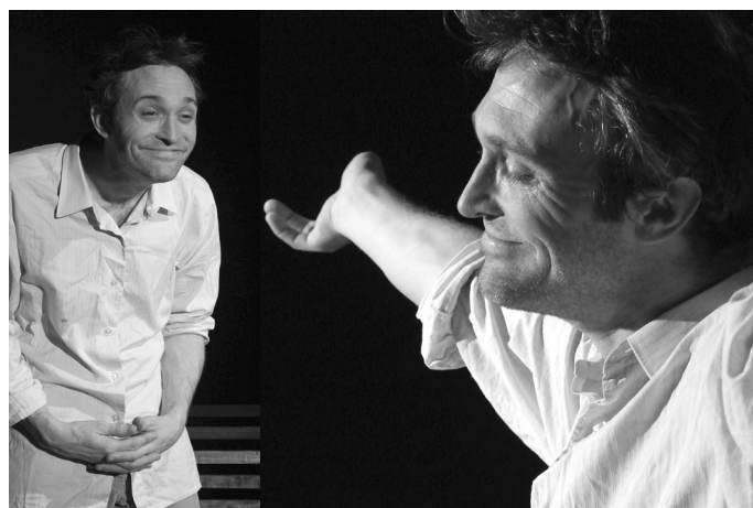
Franziskus – vielseitig, humorvoll und tiefgründig

Wir freuen uns auf Ihr Interesse und sind überzeugt, damit einen Beitrag zu Fragen von Glauben und Leben zu leisten.