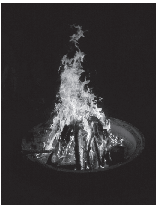
Wie schön ist es doch am Lagerfeuer...

Aus meiner Jugendzeit kenne ich zwei Kollegen, die zur See fahren. Jahrelang. Rund um den Globus. Und manch-mal ging es dabei so zu und her, dass wir Zuhörer uns anschauten, aber nie wussten, wie wir der sogenannten Wahrheit überhaupt auf die Spur kommen könnten. Nur: Gelacht, an den Geschichten gefreut und mit ihnen dann unterwegs geblieben sind wir alle bis heute. Da ist der Hafen von Rio, wo die braunen hübschen Augen meinen Kollegen sehn-suchtsvoll erwarteten. Und ich weiss noch, dass keiner von uns dabei vergass, an seine eigenen Liebschaften zu denken.