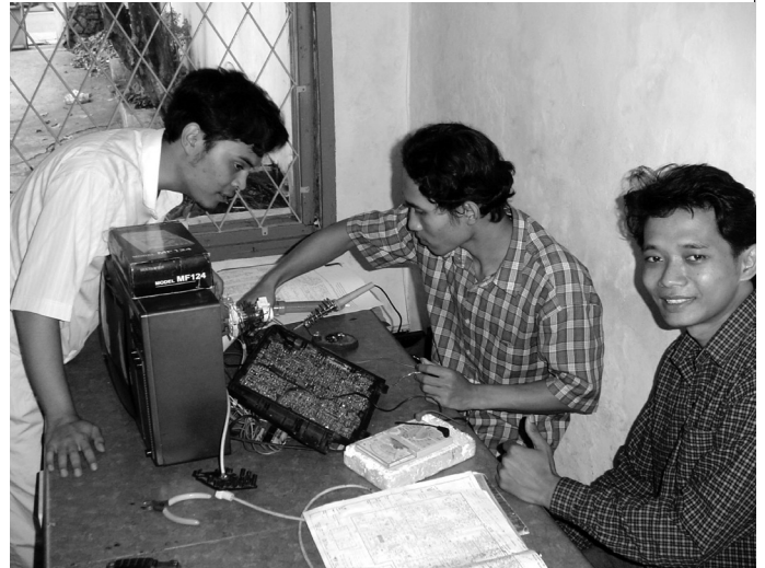
Werkstattleiter mit Schülern

Im Jahr 2011 durfte BROT FÜR ALLE total Fr. 4'782.75 aus unserer Sammlung, d.h. aus Kirchenkollekten und Privat-spenden entgegennehmen. Ein herzliches «Dankeschön» an unsere Kirchgemeindeglieder für die getätigten und auch die zukünftigen Spenden.