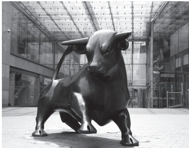
Das goldene Kalb ist zum Stier geworden!

Summiert man die problematischen Ereignisse der letzten Jahre, so möchte ich es Keinem verübeln, wenn er die Macht des Geldes als etwas Bedrohliches betrachtet. Das goldene Kalb wird heute zum bulligen Stier. Und das bestimmt, wenn man – wie es heute weit verbreitet ist – über seine Verhältnisse gelebt hat.