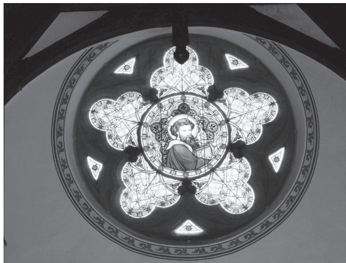
Paulus mit Bibel. Das Schwert meint die Kraft, die Gottes Wort für unser Leben hat

Nun ist es also auch bei uns geschehen. Wir sind als Kirchgemeinde im sogenannten Netz auffindbar. Mit dem Schritt in die elektronische Zukunft verbinden sich für uns keine Heilsversprechen. Und doch geht es darum, auf eine neue Art in der Öffentlichkeit präsent zu sein. Was soll die neue Form des Auftretens?