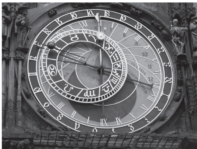
Astronomische Uhr in der Prager Altstadt