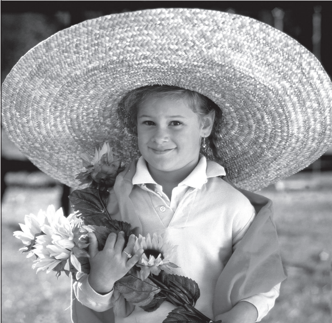
Alle Damen erhalten eine kleine Überraschung zum Muttertag