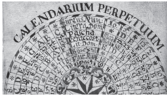
Ewiger Kalender (julianisch) 1690 in Graubünden

Genau 40 Tage nach Ostern feiern alle christlichen Konfessionen das Auffahrtsfest, welches zum Grundbestand des Christentums gehört und uns als Feiertag geschenkt ist.