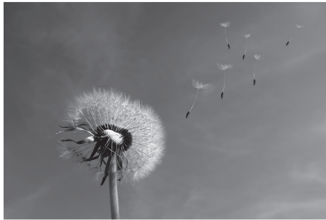
Sich selber sein und doch zusammengehören

Es läutet an der Haustüre. Endlich ist der Servicetechniker da. Er kontrolliert alles, die Maschine sieht gereinigt aus, läuft soweit und alles scheint in Ordnung. Der Fehlercode lässt sich nicht reproduzieren. Alles offen wie bei einem Wackelkontakt. Hmmm. Zweiter Versuch. Das Deckblatt hinten wird abgeschraubt. Sind die Sensoren ok? Staub scheint auch hier nicht besonders viel zu liegen. Das Deckblatt über dem Zuluftkanal wird gelöst und hier sieht's anders aus. Viel Staub, selten viel, meint der gute Mann. Absaugen, abwischen... Zuschrauben und vielleicht läuft sie wieder richtig. «Sonst rufen Sie halt wieder an.» Eine wohlbekannte Szene.