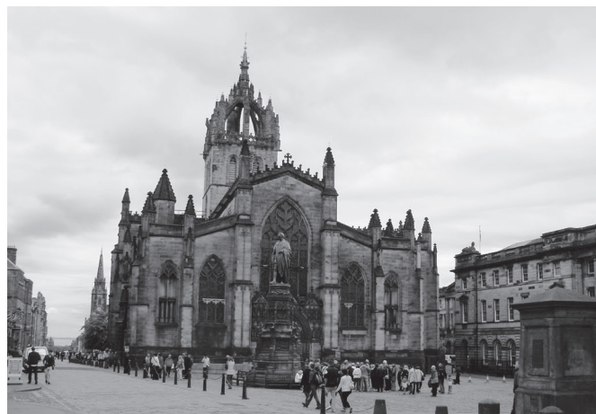
St. Giles Cathedral in Edinburgh