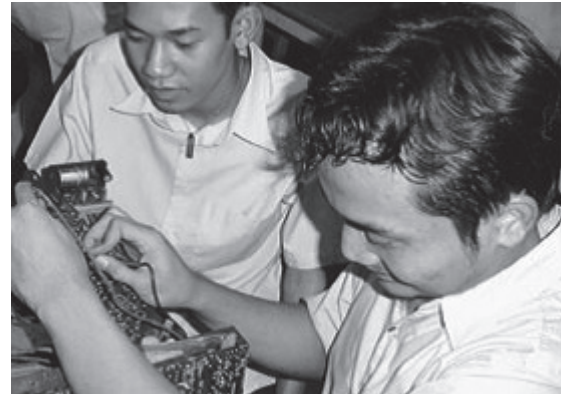
Berkat-Schule in Bandung, Elektronik-Ausbildung für junge Erwachsene

Für Ihre direkte Spende mit dem beiliegenden Einzahlungsschein von «mission 21» danken wir herzlich!