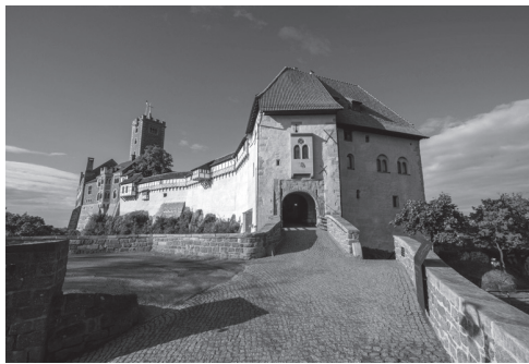
Die Wartburg – Martin Luthers Versteck als Junker Jörg vom 4. Mai 1521 bis 1. März 1522

Was damals begonnen wurde, brachte die Menschen unserer Länder zu mehr Eigenverantwortung, Autonomie und Selbstbewusstsein. Und so hat es auch die Zukunft entscheidend mitgestaltet. Natürlich ist die neue Glaubensart nicht ohne schlimme Erfahrungen durchgekommen, auch nicht ohne selber Leiden verursacht zu haben - leider.