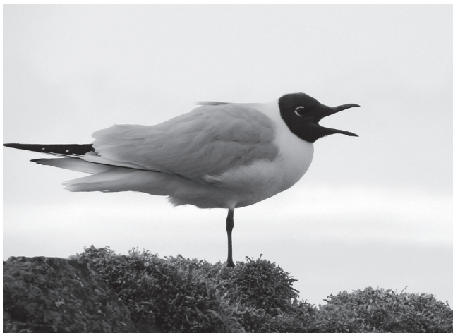
Möve im Wind am Fareid Head in Durness (Nördlichstes Dorf der schottischen Westküste)

«Sei treu bis in den Tod und ich werde dir die Krone des Lebens reichen» (Offb. 2,10) erhält als biblische Vision eine ganz neue Aktualität.