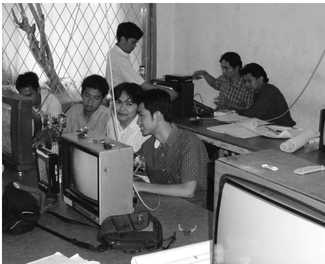
Praktische Ausbildung der Schüler

Die Christliche Pasundan-Kirche in Bandung bietet Elektronikurse mit integriertem Werkstattbetrieb für Jugendliche an. An der Schule «Berkat Elektronik» im Ort Sukabumi können sich pro Jahr bis zu 40 Schülerinnen und Schüler praktisch und theoretisch ausbilden lassen und sich so den Weg ebnen aus der Arbeitslosigkeit in die Selbständigkeit oder für eine Beschäftigung in einem Industriebetrieb.