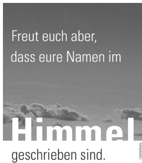
Lukas 10, 20