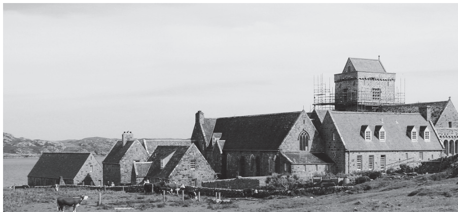
Iona Abbey - Zentrum der weltweiten Iona Community (Hier gegen Osten mit der Insel Mull im Hintergrund)

Ein Besuch der Insel Iona an der schottischen Westküste ist vom Naturerlebnis her eine grosse Bereicherung. Die urige Landschaft am Rande der belebten Welt wird von vielen Reisenden aufgesucht. Die Meisten aber suchen mehr als ein schlichtes Naturerlebnis.