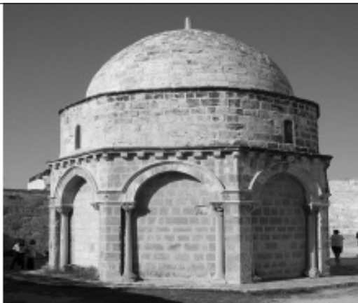
«Ascensio» in Jerusalem

Es freut sich: Eurer Kinderteam. (Persönliche Einladung per Post)