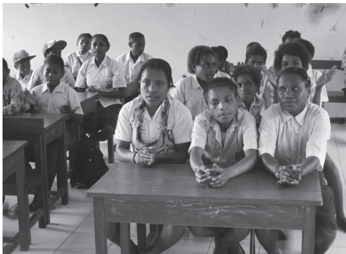
Schule in Indonesien - unser Mission21 Projekt

Es ist an der Zeit, vorwärts zu denken statt zu resignieren. Das ist Mission, wie sie heute den Menschgewordenen als Licht in der Finsternis erfährt – christlich gesprochen. Aber auch andere Religionen haben die Aufgabe, ihren Beitrag zu leisten, mit anderen Bildern, aber auf dasselbe Ziel hin, dieser Welt einen Dienst zu erweisen. Vielleicht muss sich unsere Kirche dafür etwas von der sogenannten Welt distanzieren, sich auf ihre Wurzeln und eigenen Werte besinnen und so frische Ideen einbringen. Helfen wird dazu gehören, hoffentlich als fröhliche Tat!