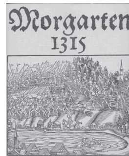
Die Schlacht am Morgarten, aus Der Schweizer Chronik von Johannes Stumpf, 1547

Freuen Sie sich auf einen unterhaltsamen Nachmittag in fröhlicher Runde am Mittwoch, 26. November 2014 14.15 Uhr, Kirchgemeindehaus Oberarth