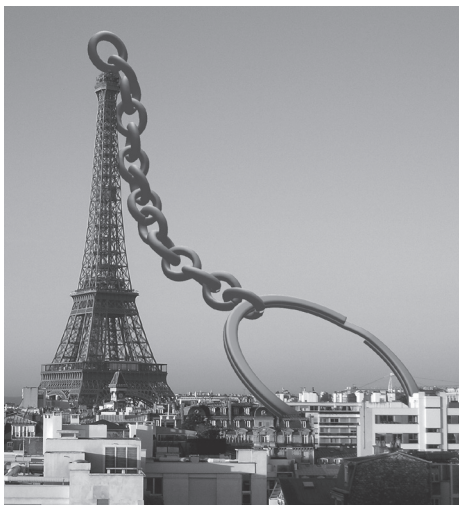
Mehr mitnehmen als nur ein Feriengefühl

Der biblische Grundsatz, der dieses Jahr wieder einen Konfirmanden ins Leben begleitet, lautet: „Prüft alles, das Gute behaltet“ (1. Thess. 5,21). Mich freuts, dass die Bibel sich offen dem Leben zuwendet. „Prüft alles“ Das mutet mir zu, dass ich mich nicht an Leitlinien anderer halte. Dieses Prüfen obliegt mir selber. Ich soll Verantwortung übernehmen. Das ist zwar anstrengend; denn es ist nicht einfach, sich einem eigenen Urteil zu verpflichten. Waren Sie etwa auch schon mal enttäuscht, wenn sie später erfahren haben, dass ihre Gedanken auf Nachrichten beruhen, die sich später als unwahr erwiesen haben?